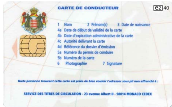
Carte de conducteur