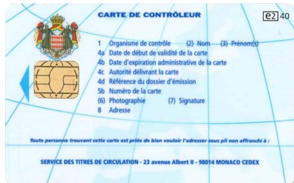
Carte de contrôleur (personne morale)